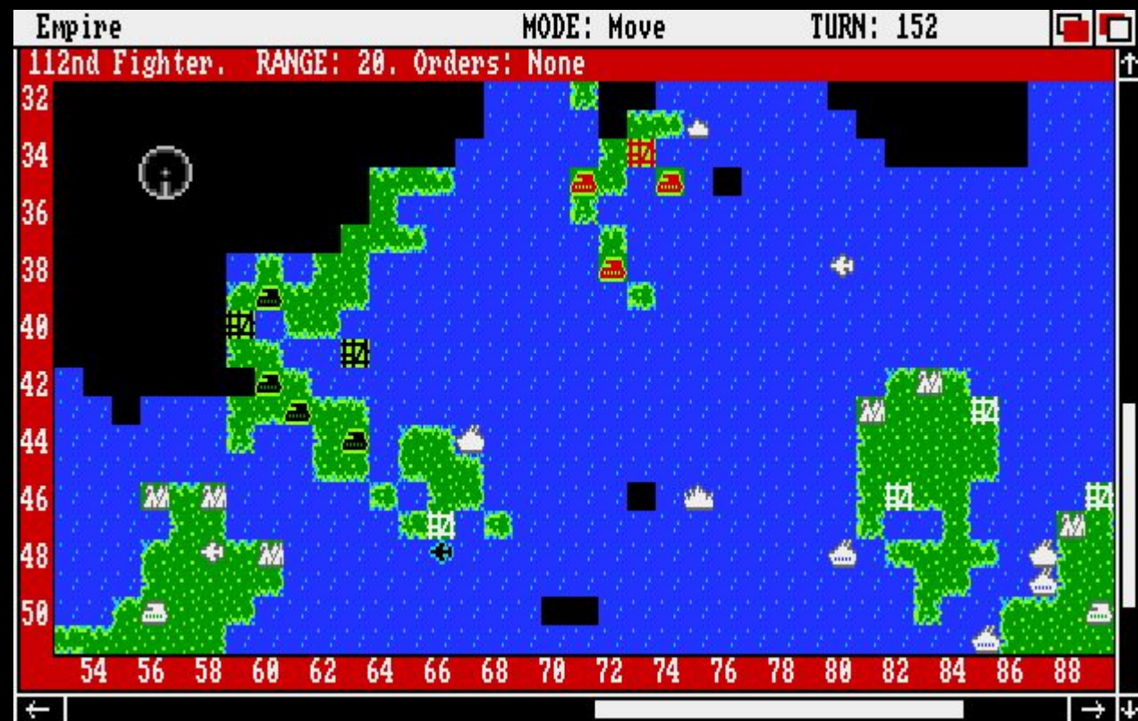
Empire: Wargame of the Century для Amiga