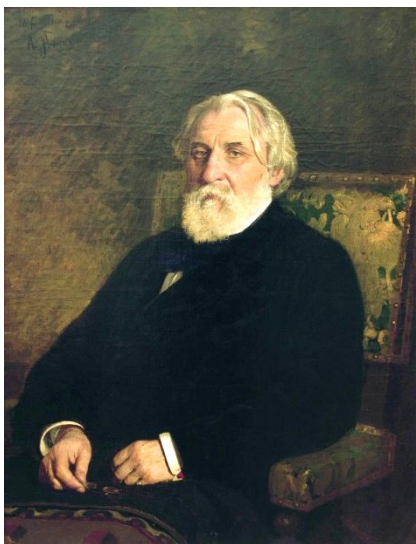
Иван Сергеевич Тургенев – 9 ноября 1818 года – 1883