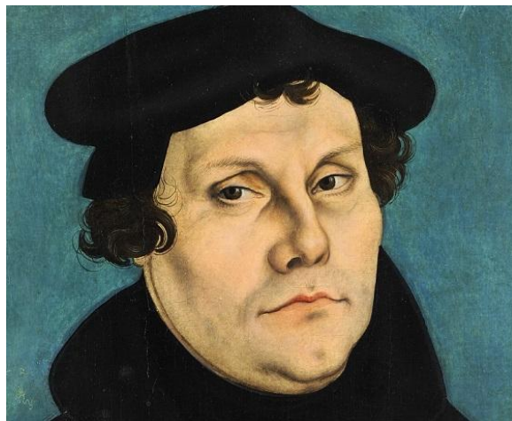
9 ноября 1483 – 1546