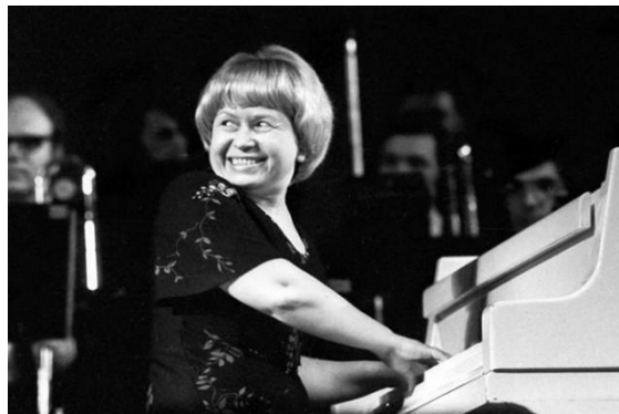
Александра Николаевна Пахмутова – 9 ноября 1929 года

МИР карточки – знаменитые люди