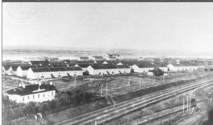
Соляные амбары в Рыбинске. Начало XX века. Снимок сделан с водонапорной башни.