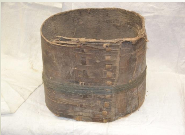
Вьюшка из коры дерева с льняными нитями.