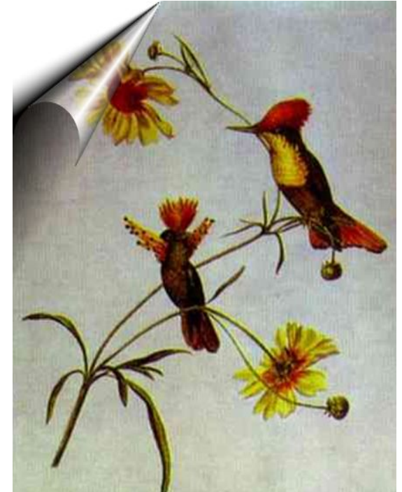
Птицы и цветы