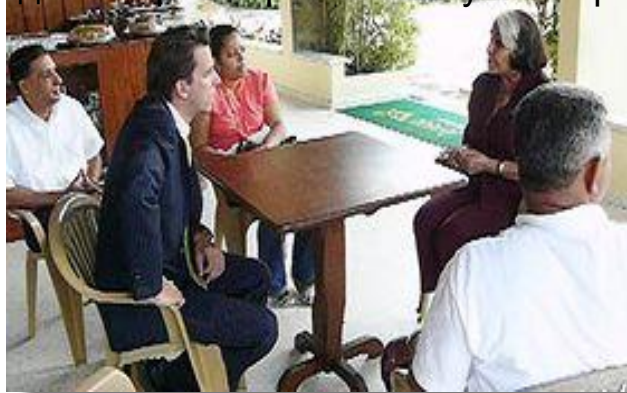
Деде Мирабаль (единственная сестра пережившая 25.11.1960) с журналистами в музее Сестёр.

Одной из любимых фраз диктатора Трухильо была такая: « Тот, кто не мой друг, мой враг, и, следовательно, он за это поплатится », поэтому неудивительно, что отважные сёстры, как и их мужья, неоднократно попадали в тюремные застенки. Однако они по прежнему считали делом жизни установление на своей родине справедливости и демократии. Все они являлись членами подпольного общества « Революционного движения 14 июня », которое возглавлял муж Минервы Маноло Таварес Хусто. В народе Сёстры Мирабаль получили прозвище «Бабочки Мирабаль».