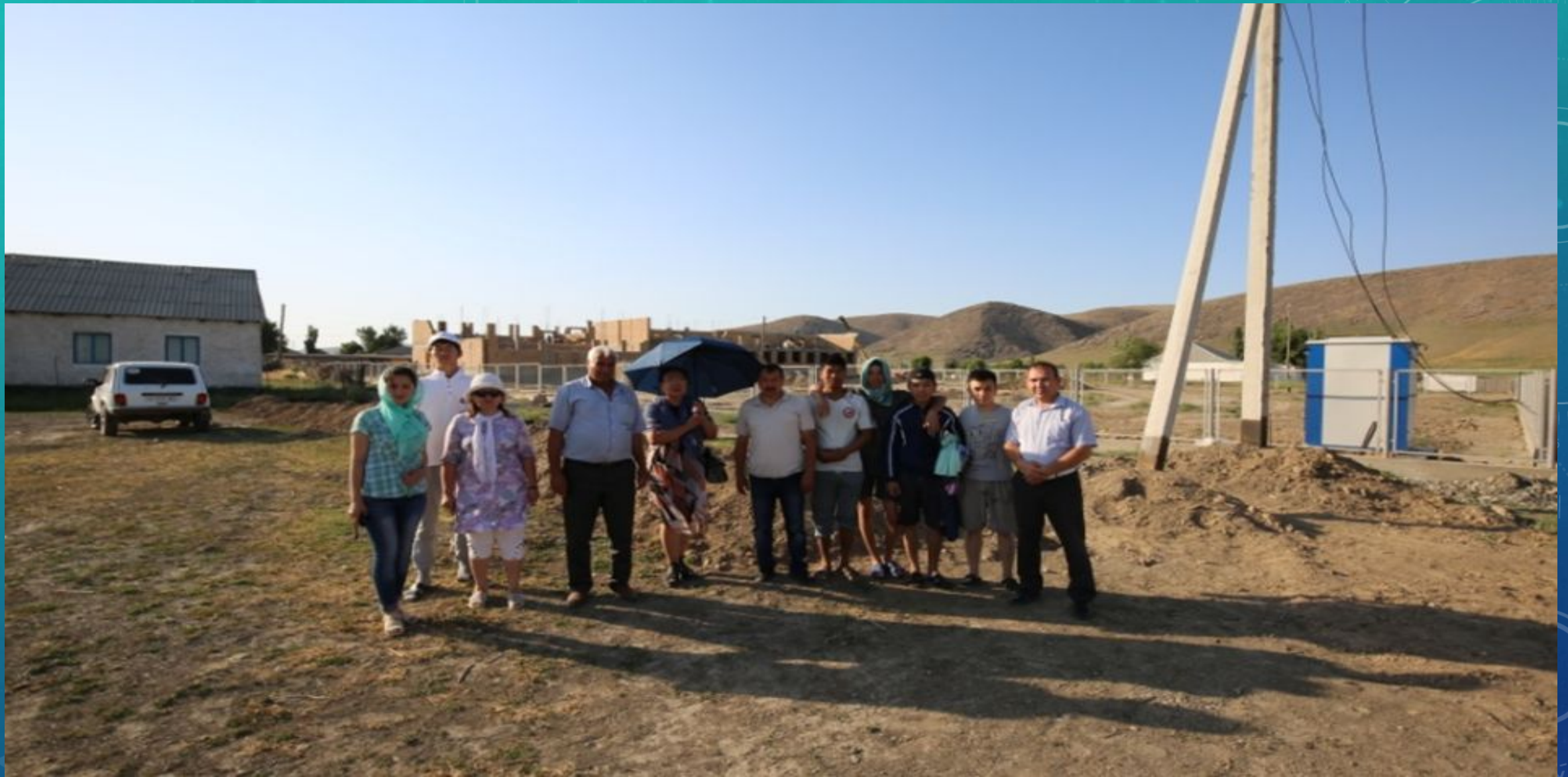
«ҚАСҚАБҰЛАҚ» АУЫЛЫНЫҢ ӘКІМІ ЖӘНЕ ТАРМУ ҚҰРЫЛЫС ОТРЯДЫ СТУДЕНТТЕРІМЕН