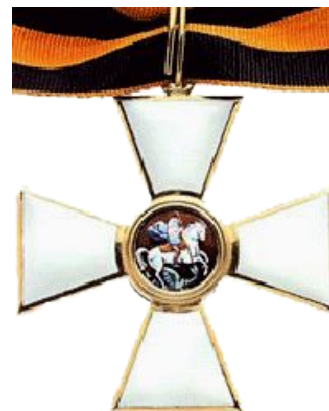
Орден Святого Георгия