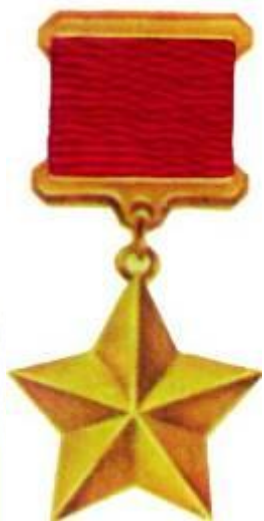
Звезда Героя Советского Союза