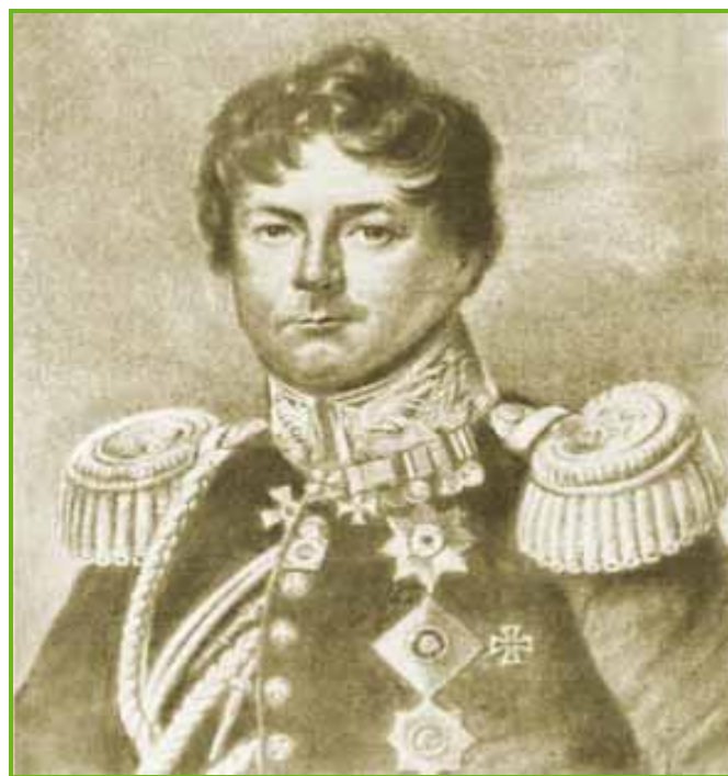
Иван Иванович Дибич-Забалканский