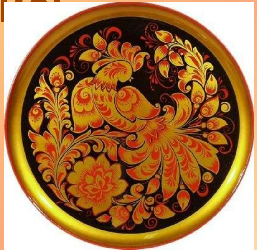
Тарелка - панно