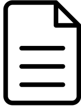
Проект. Версия 2.