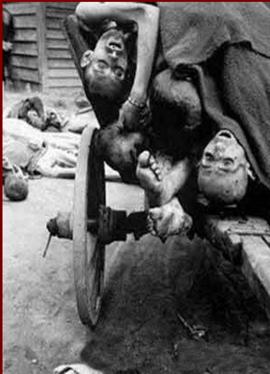
Заклученные концлагеря в Бухенвальде