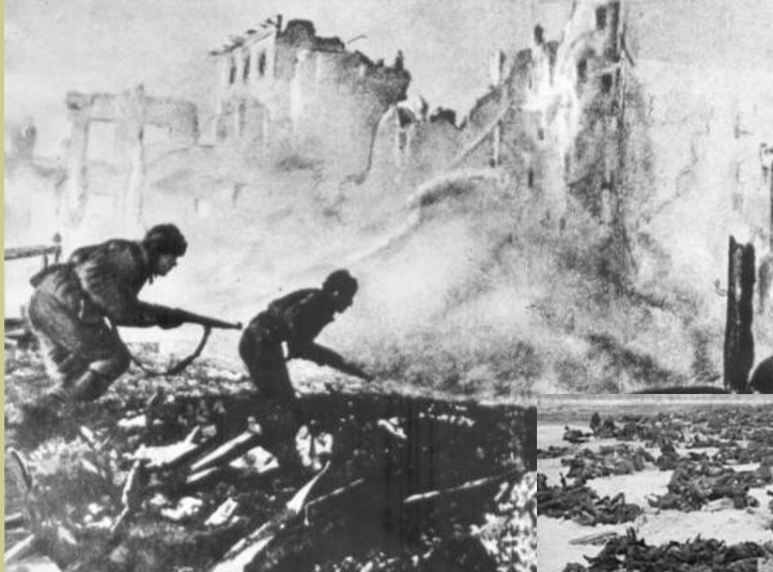
Уличные бои («крысиная война»)