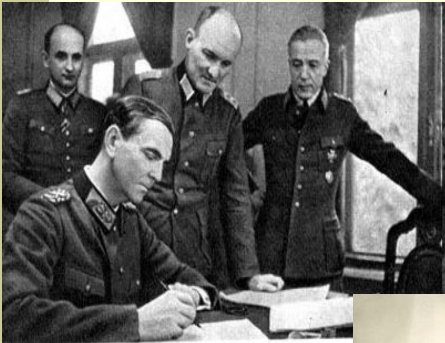
Ф. Паулюс (генерал танковых войск)