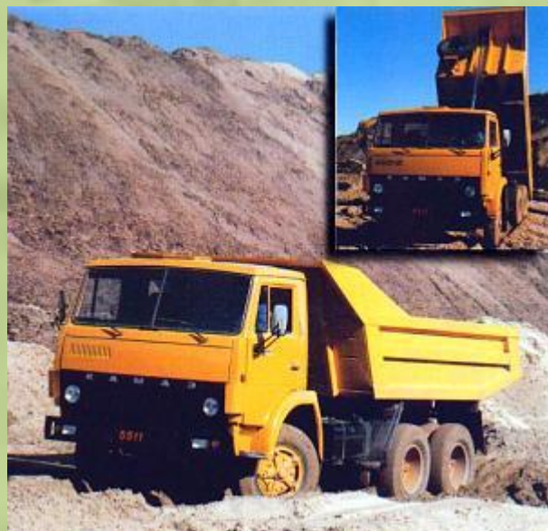
ОТКРЫТЫЙ (С ПОВЕРХНОСТИ)