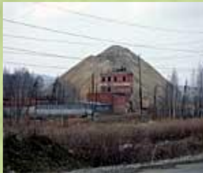
ЗАКРЫТЫЙ (В ШАХТАХ)