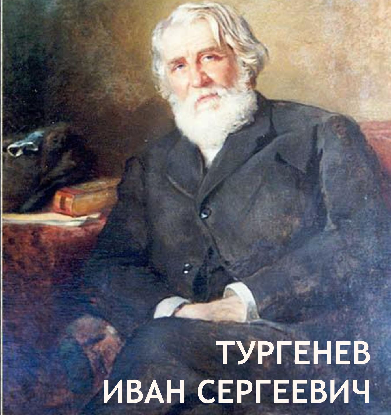
ТУРГЕНЕВ ИВАН СЕРГЕЕВИЧ