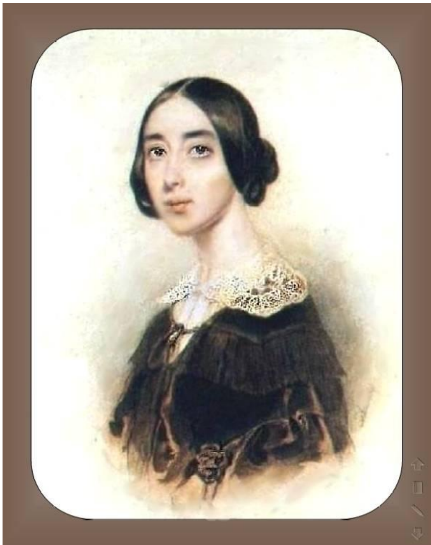
Полина Виардо (Виардо-Гарсия)