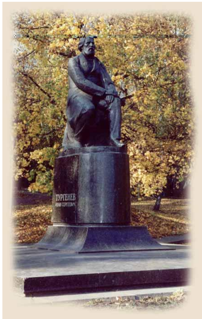
Памятник Тургеневу И.С.