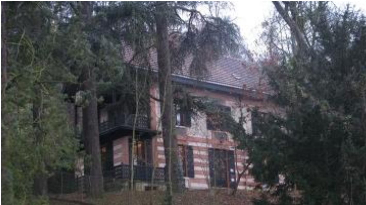
Дом Тургенева в усадьбе «Ясени» в Буживале

К концу жизни слава Тургенева достигла своего апогея как в России, где он опять становится всеобщим любимцем, так и в Европе, где критика, в лице самых выдающихся своих представителей - Тэна, Ренана, Брандеса и др. - причислила его к первым писателям века.