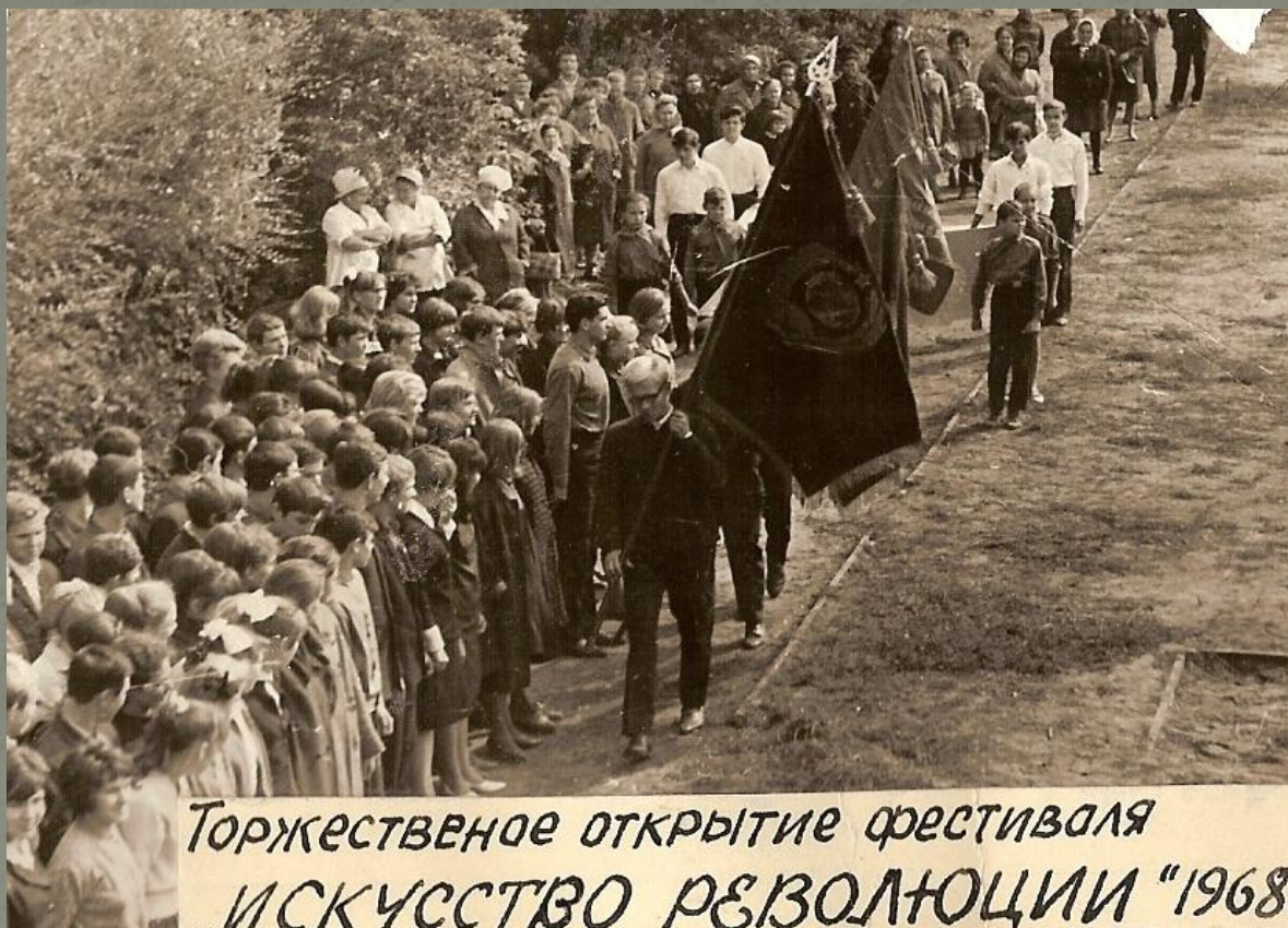
Торжественное открытие фестиваля ИСКУССТВО РЕВОЛЮЦИИ "1968.

Именно с первым директором школы № 127 связано появление первых традиций.