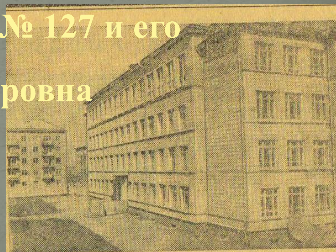
На Кировском жилмассиве построена школа, где будет обучаться 1.600 ребят. В ней оборудуются специальные кабинеты химии, физики, биологии. Около школы построена мастерская со столярным и токарным кабинетами. На снимке: школа № 127 Кировского жилмассива.