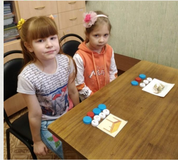
Слова РАК, СТОЛ