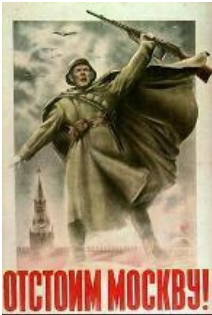
Плакат 1941 г.

Для захвата Москвы был подготовлен план «Тайфун». Немцы попытались достичь на этом направлении 3-кратного превосходства в живой силе и технике. 30 сентября началось генеральное наступление. Под Вязьмой и Брянском советские войска попали в окружение, но сковали действия врага. Оборону Москвы возглавил Г. Жуков. В ноябре враг подошел к городу и в Москве было объявлено осадное положение.