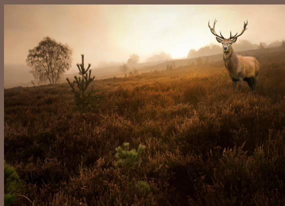
Panta de Siberia