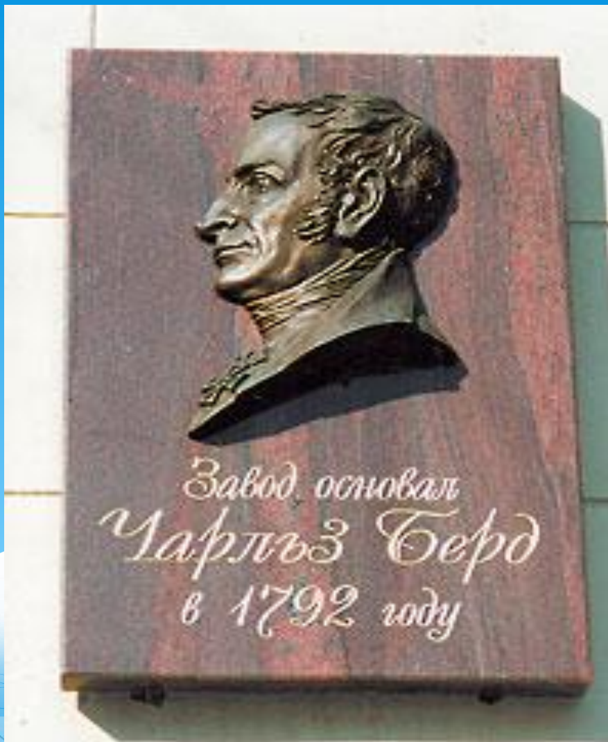
Мемориальная доска, установленная на заводе Берда

Чарльз (Карл Николаевич) Берд (1766-1843) русский инженер и бизнесмен шотландского происхождени я, первый строитель пароходов на Неве.