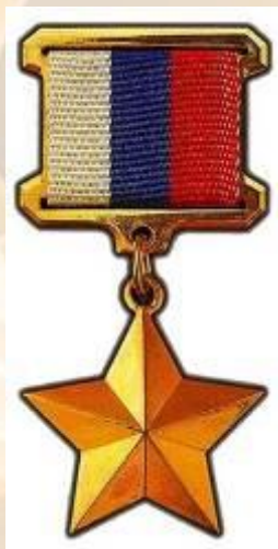
Звезда Героя Российской Федерации