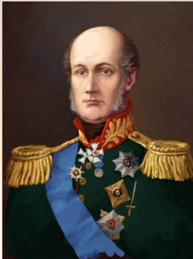
Михаил Богданович Барклай-де-Толли