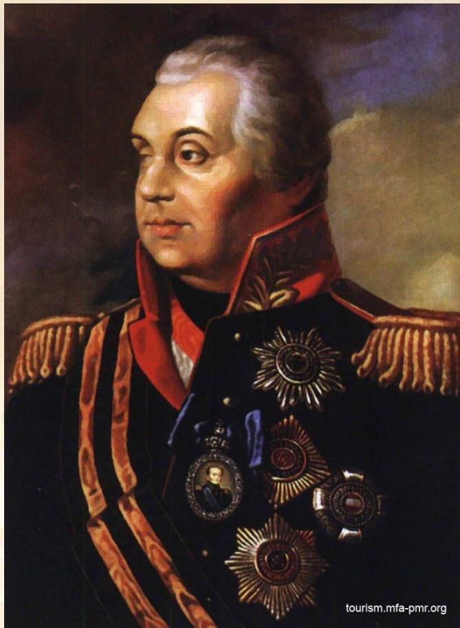
Михаил Илларионович Кутузов