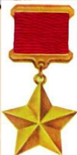
Звезда Героя Советского Союза