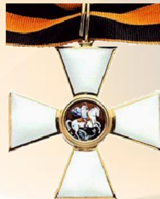
Орден Святого Георгия