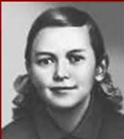
Зина Портнова- герой Советского Союза