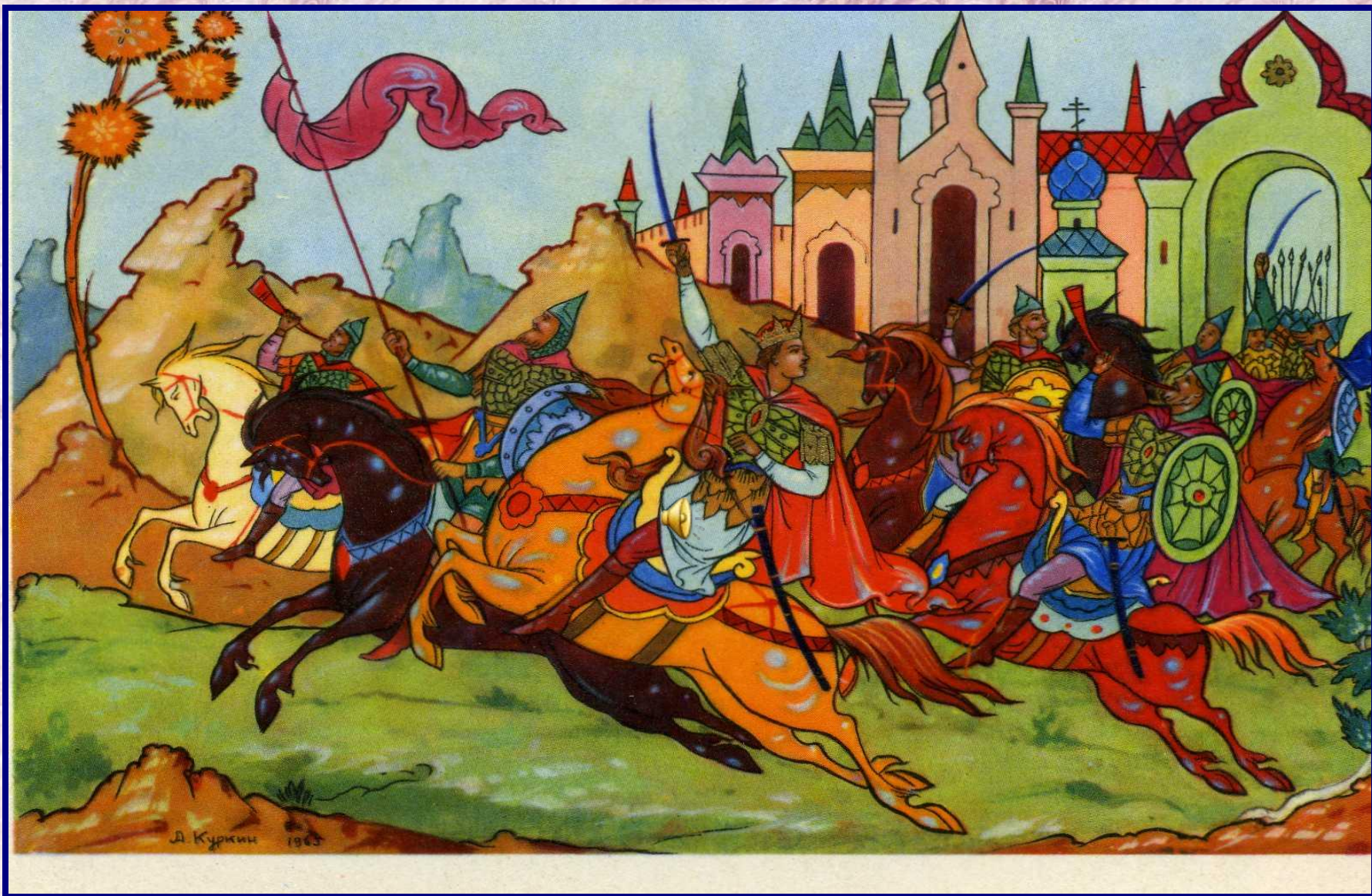
Н.А.Римский-Корсаков Опера «Сказка о царе Салтане»