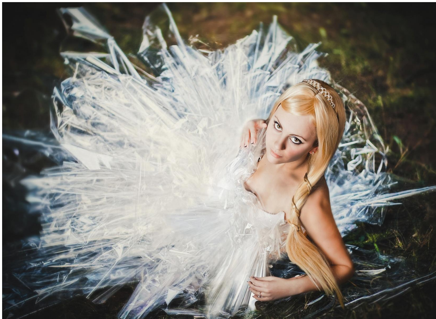
Фотопортрет «Царевна Лебедь»