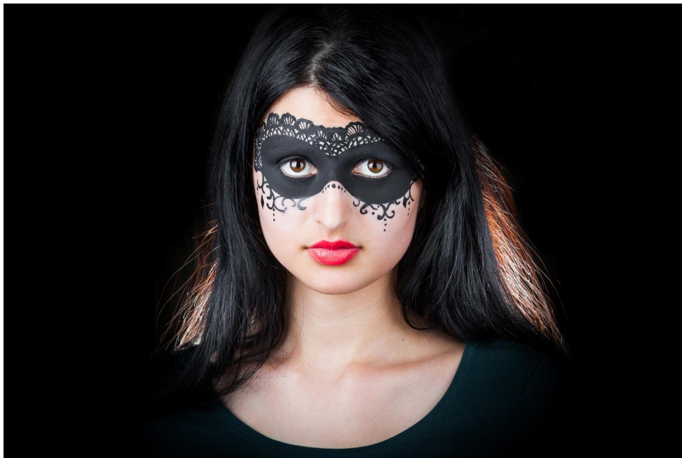
Фотопортрет «Карнавальная ночь»