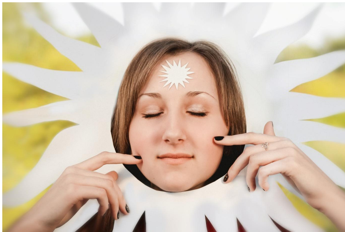
Фотопортрет «Светоч знаний»