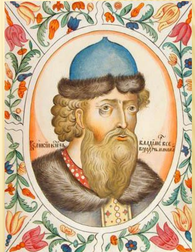
Великий князь Владимир Всеволодович Мономах. Портрет из царского титулярника. 1672 год