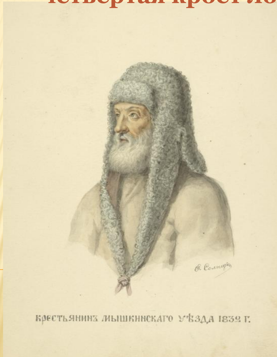
КРЕСТЬЯНИНЪ ЛЫШКЕНСКАГО УѢЗДА 1832 Г.

Малахай — большая ушастая шапка на меху. Две лопасти кроют щеки, одна — затылок, четвёртая кроет лоб.