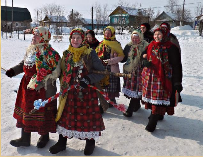
«Вой дыр», удмуртская масленица