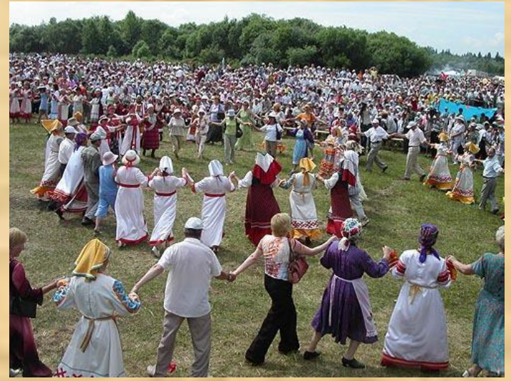
«Гербер»-праздник окончания весенних полевых работы