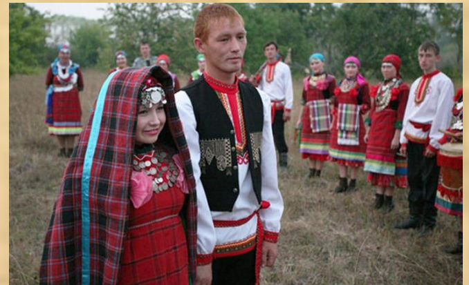
Жизнь удмуртов -это свадьба.