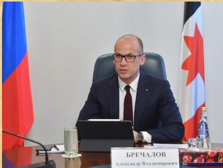
Александр Владимирович Бречалов- Президент Удмуртской Республики