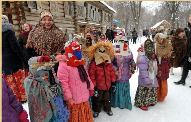
«Вождыр»-удмуртский вариант святка.