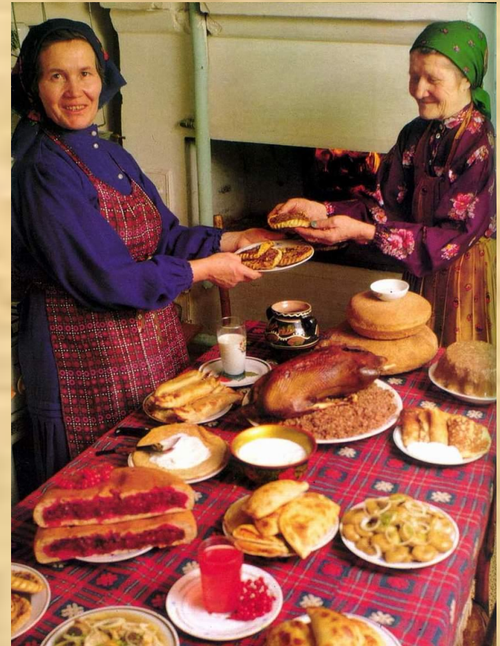
Удмуртская традиционная кухня