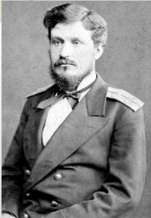
Андрей Антонович Горенко 1848—1915