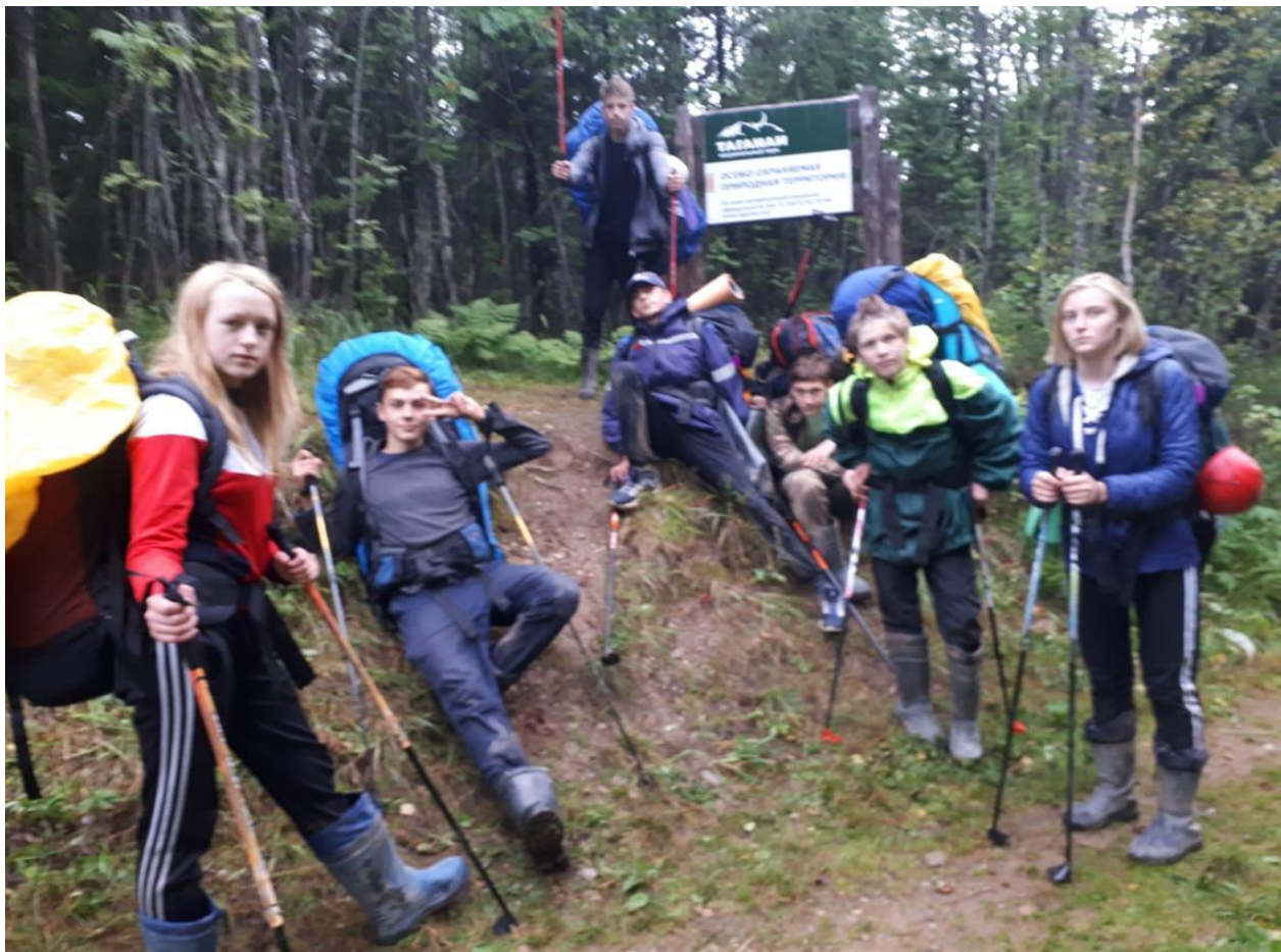
3 день маршрута Перевал Горелый