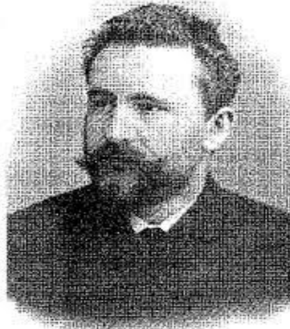
Э. Крепелин (1856—1926)

Олигофрения терминін 1915 жылы Е.Крепелин ұсынған