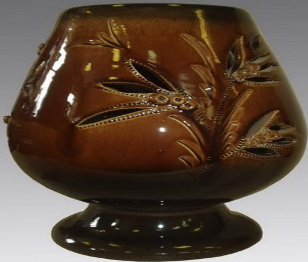
ваза «Пион» h-28