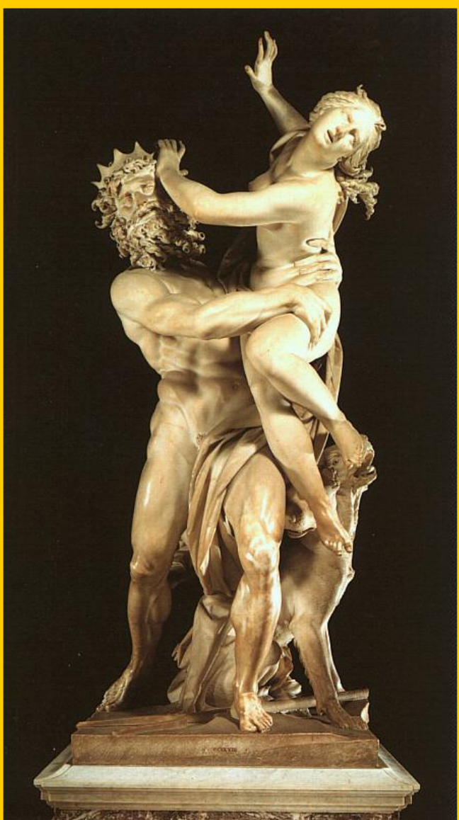
Аид похищает Персефону.

С именем Аида связан один из самых знаменитых древнегреческих мифов - О богине Деметре и ее дочери Персефоне.