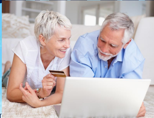
Программа негосударственного пенсионного обеспечения