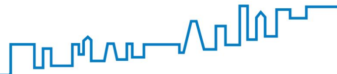
Инженерная подготовка и защита территории