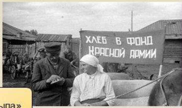
Видео «Работа тыла»