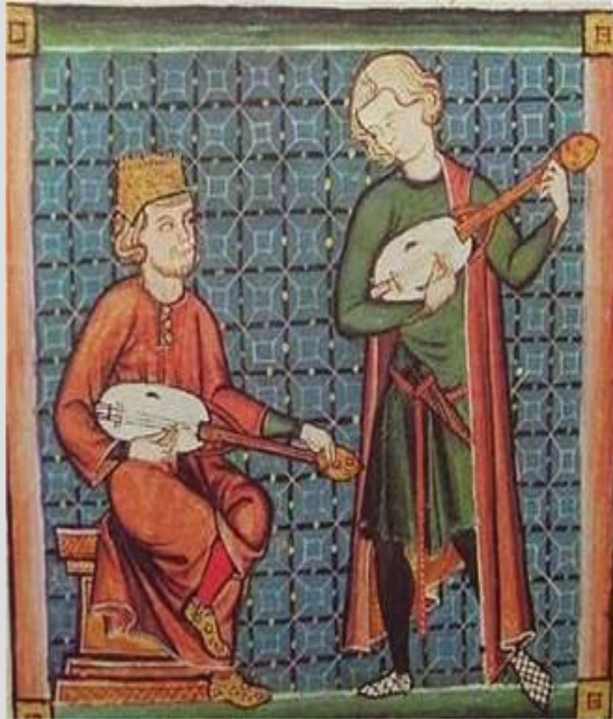
Рис. 1. Средневековый фольклор