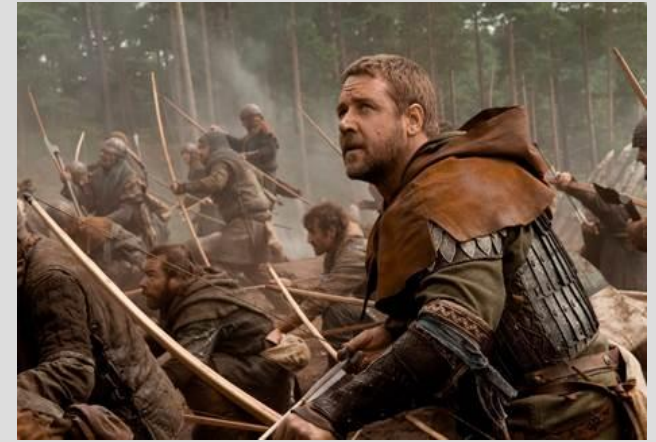
Рис. 8. Робин Гуд (кадр из х/ф «Робин Гуд», 2010)