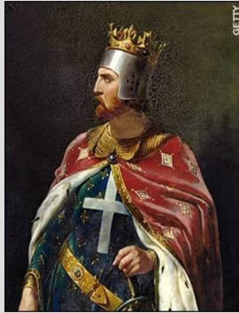
Рис. 7. Ричард Львиное Сердце – король Англии