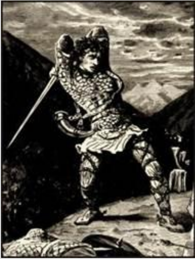
Рис. 6. «Песнь о Роланде»