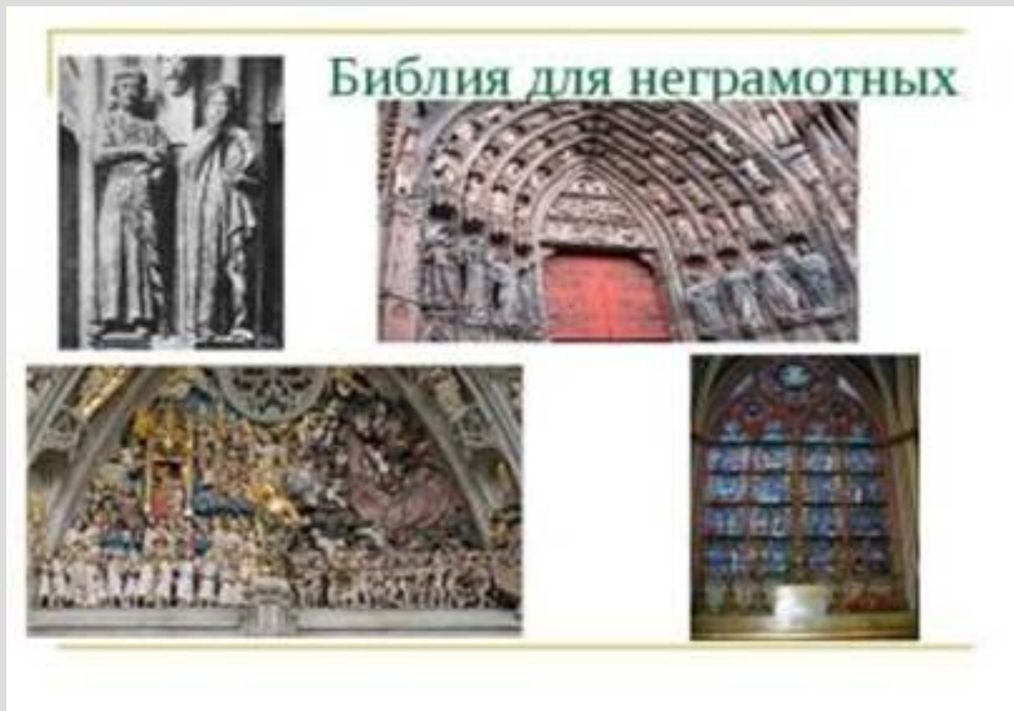
Рис. 2. «Библия для неграмотных»