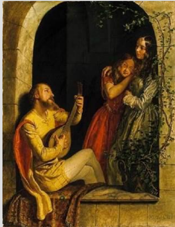
Рис. 4. Средневековый трубадур

Культура аристократии представлена любовными стихами трубадуров (Рис. 4), рыцарскими поэмами о героях круглого стола.