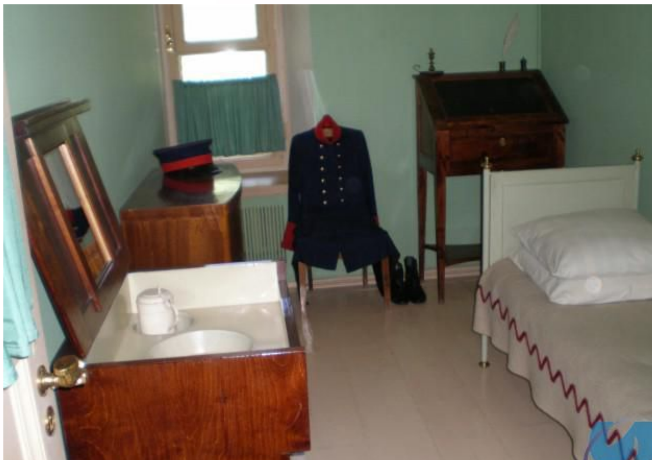
Комната А.С.Пушкина в Царскосельском лицее