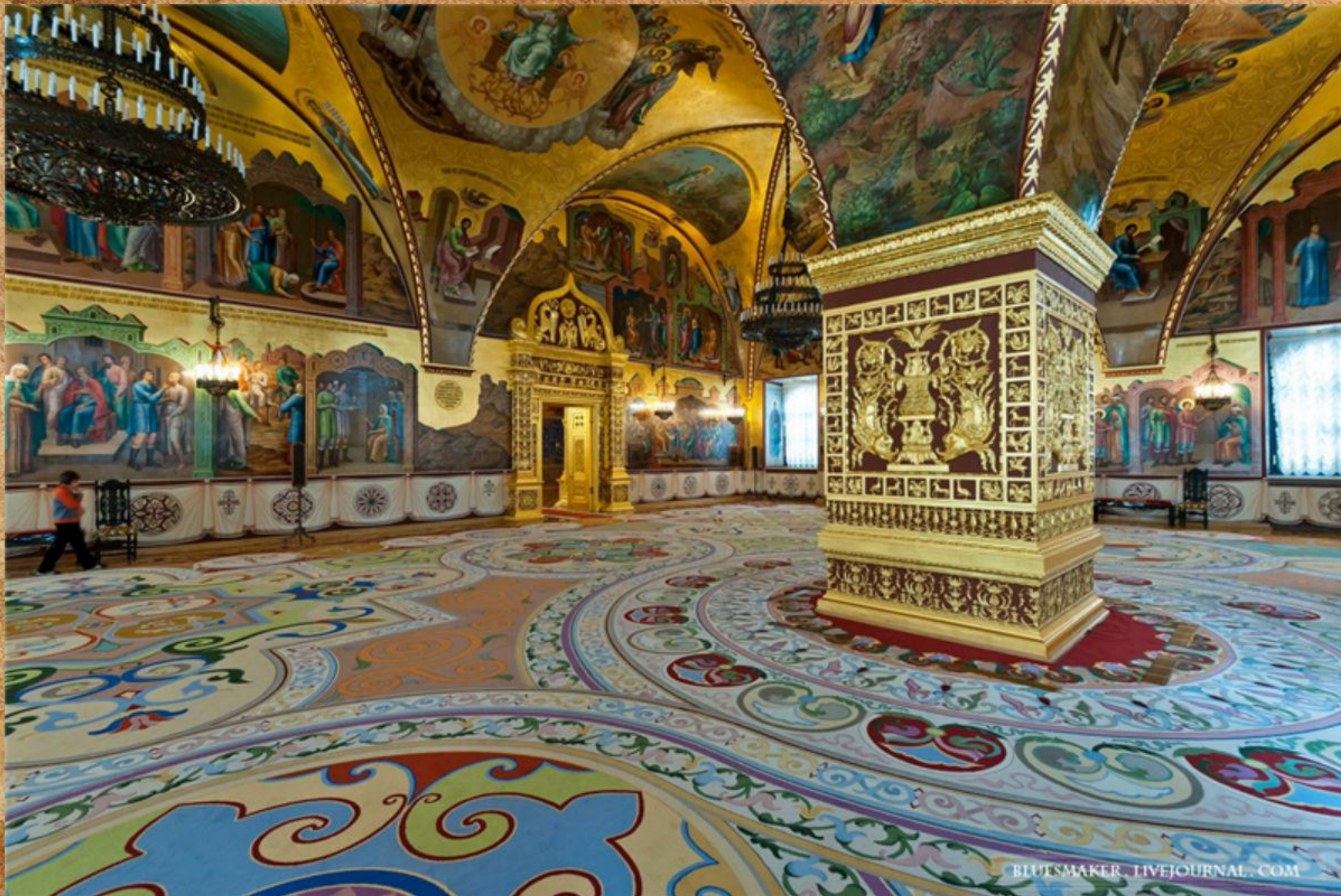
Роспись Грановитой палаты Кремлевского дворца жив. Симон Ушаков