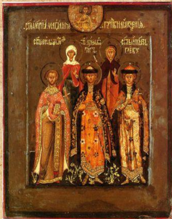
Семейная Икона Бориса Годунова