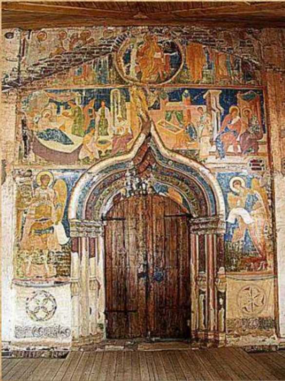
Росписи Ферапонтова монастыря. 1490-1503.

Дионисий (1440-1502) Основными сюжетами в его живописи оставались сюжеты из Библии и Евангелия, лики святых. Однако в отличие от Рублёва, в работах Дионисия прослеживается стремление к внешней красоте, пышности.