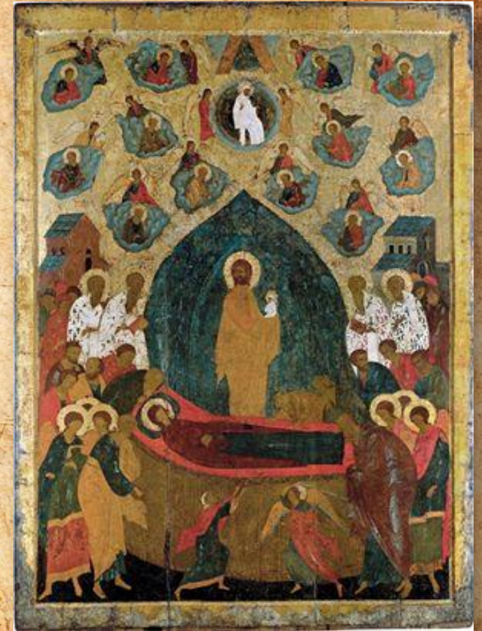
Успение. 1500 г.