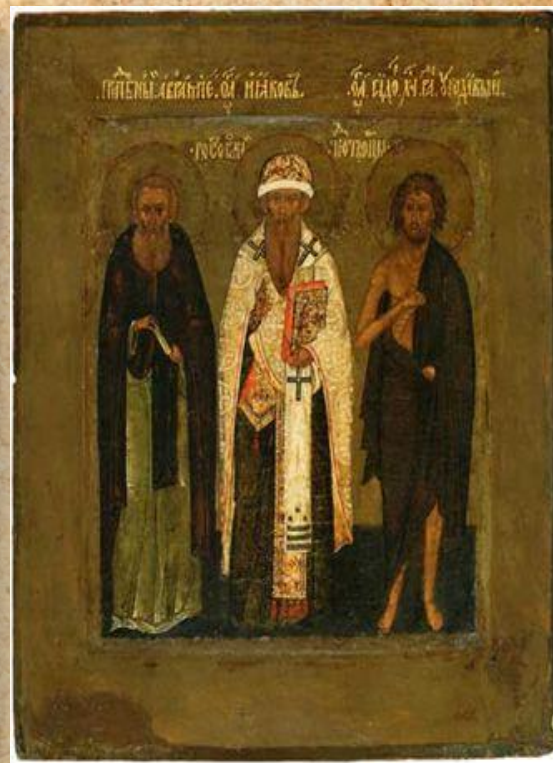
Святитель Иаков, преподобный Авраамий и блаженный Исидор Твердислов Ростовские