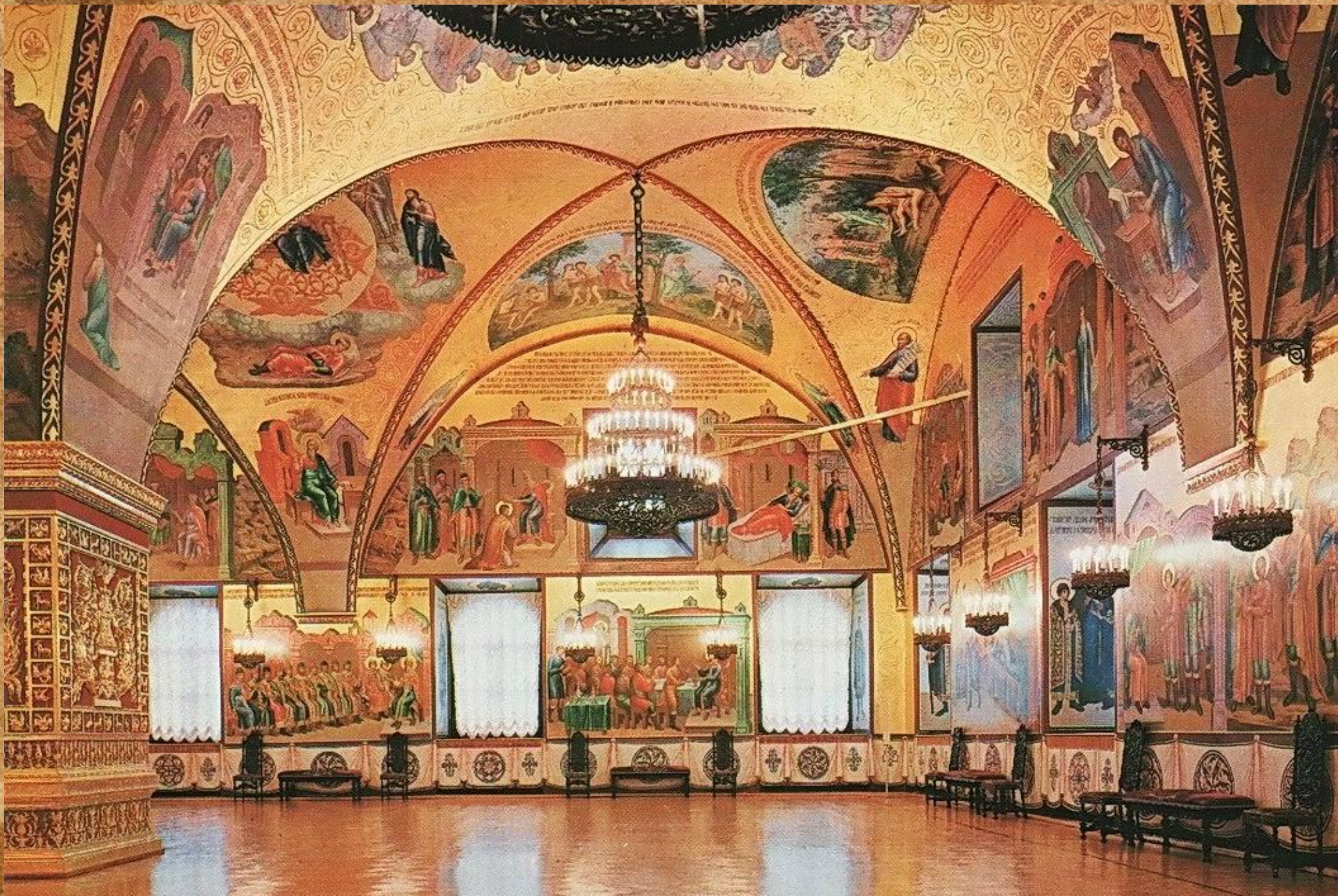
Роспись Золотой палаты Кремлевского дворца жив. Симон Ушаков