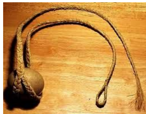
Праща с камнем