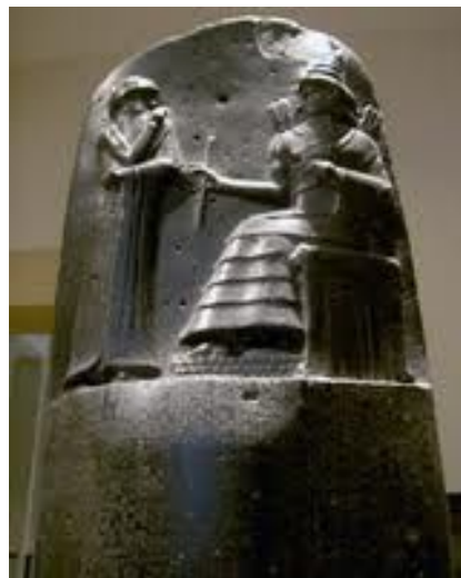
Камень с клинописью