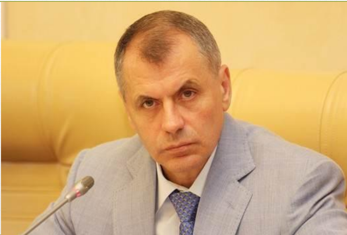
Председатель Государственного Совета Республики Крым Владимир Андреевич Константинов