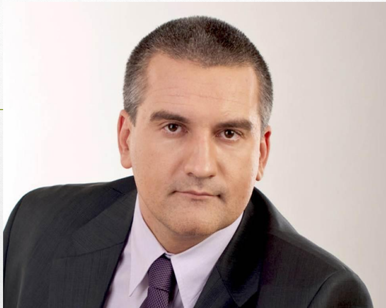
Глава Республики Крым Сергей Валериевич Аксёнов