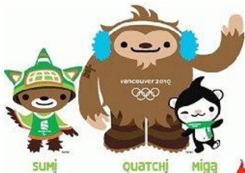
sumi quatchi miga