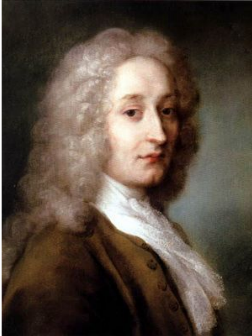
Жан Антуан Ватто (1684—1721)