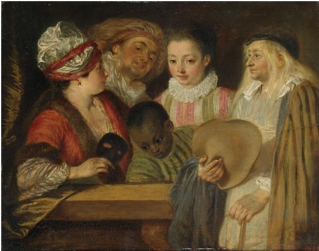
Актеры французской комедии дель арте, 1714-1715 гг.

Антуан Ватто (1684 – 1721) родился в Валансьене, небольшом городке на границе Франции и Фландрии. Художник застал кризисный период французской истории, период регентства, когда его пограничный городок перешел в состав Фландрии. Учителем Ватто был малоизвестный художник, театральный декоратор. Когда его пригласили делать декорации для парижской оперы в 1702 году, Ватто переехал вместе с ним в Париж — город больших возможностей для начинающих "моршанов", ведь там уже формируется рынок искусства.