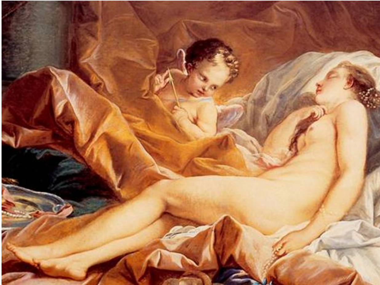
Буше. Спящая Венера. Фрагмент

Никто из художников Франции не воплотил в своих работах столь полно и многогранно главные черты этого стиля — гедонизм (удовольствие как цель жизни), легкую фривольность, вкус к изысканной роскоши и пренебрежение обыденным, разумным, устойчивым нравам.