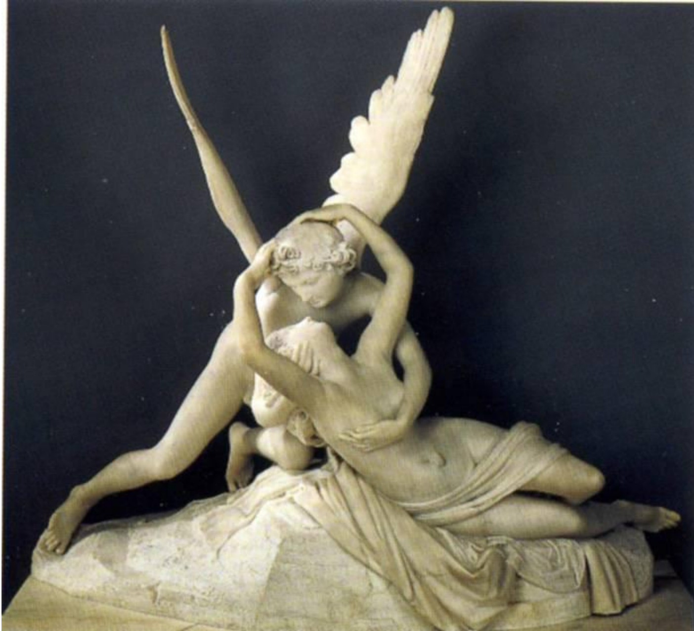
Канова «Амур и Психея»