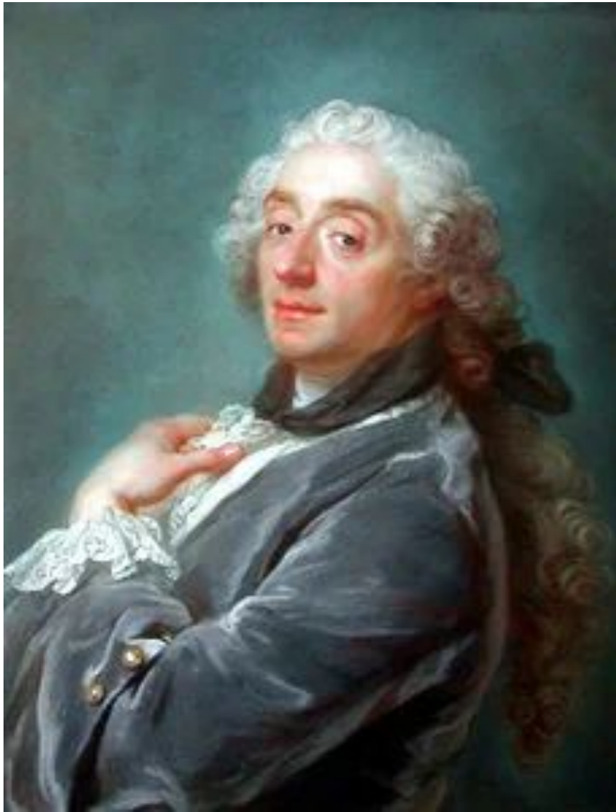
Портрет Франсуа Буше. Густав Лундберг