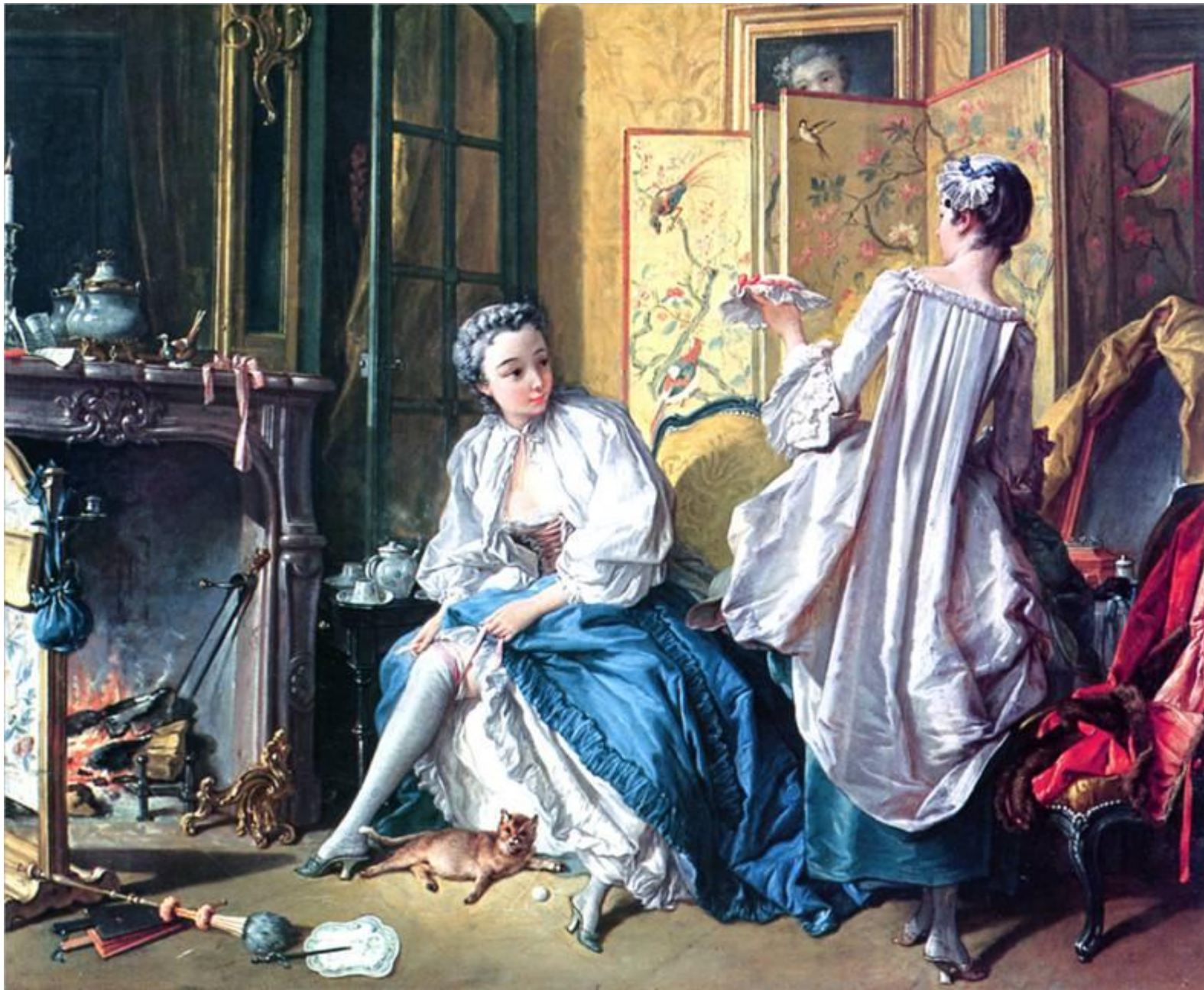
Дама, завязывающая подвязку чулка, и служанка. 1742