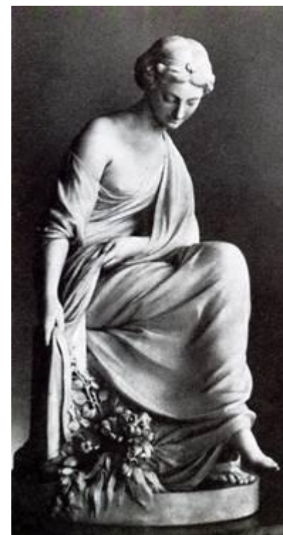
Фарфор Фальконе «Нимфа с луком» Бисквит Севр 1761