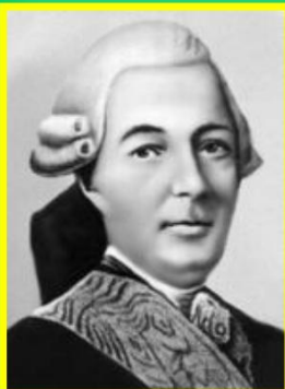
Бецкой Иван Иванович

И.И. Бецкой составил доклады и уставы, прежде всего «Генеральный план воспитательного дома» (1764) и «Краткое наставление...о воспитании детей».