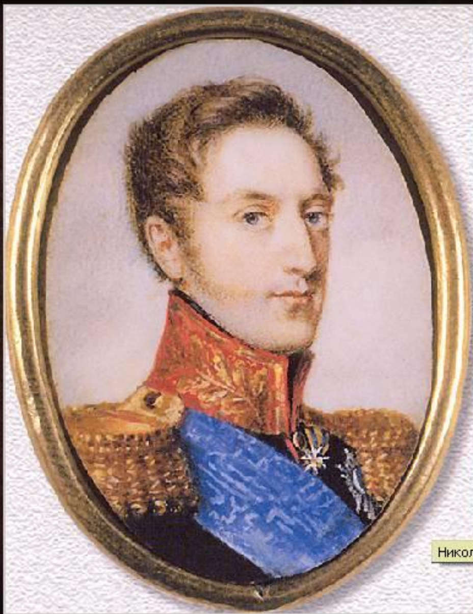
Николай I. Портрет 1826 года. Неизвестный художник

Новый император Николай I не решился сразу на подавление восстания: он не хотел начинать свое царствование с кровавой расправы, да и многие воинские части колебались и были ненадежны. К восставшим стали прибывая их сдаваться.