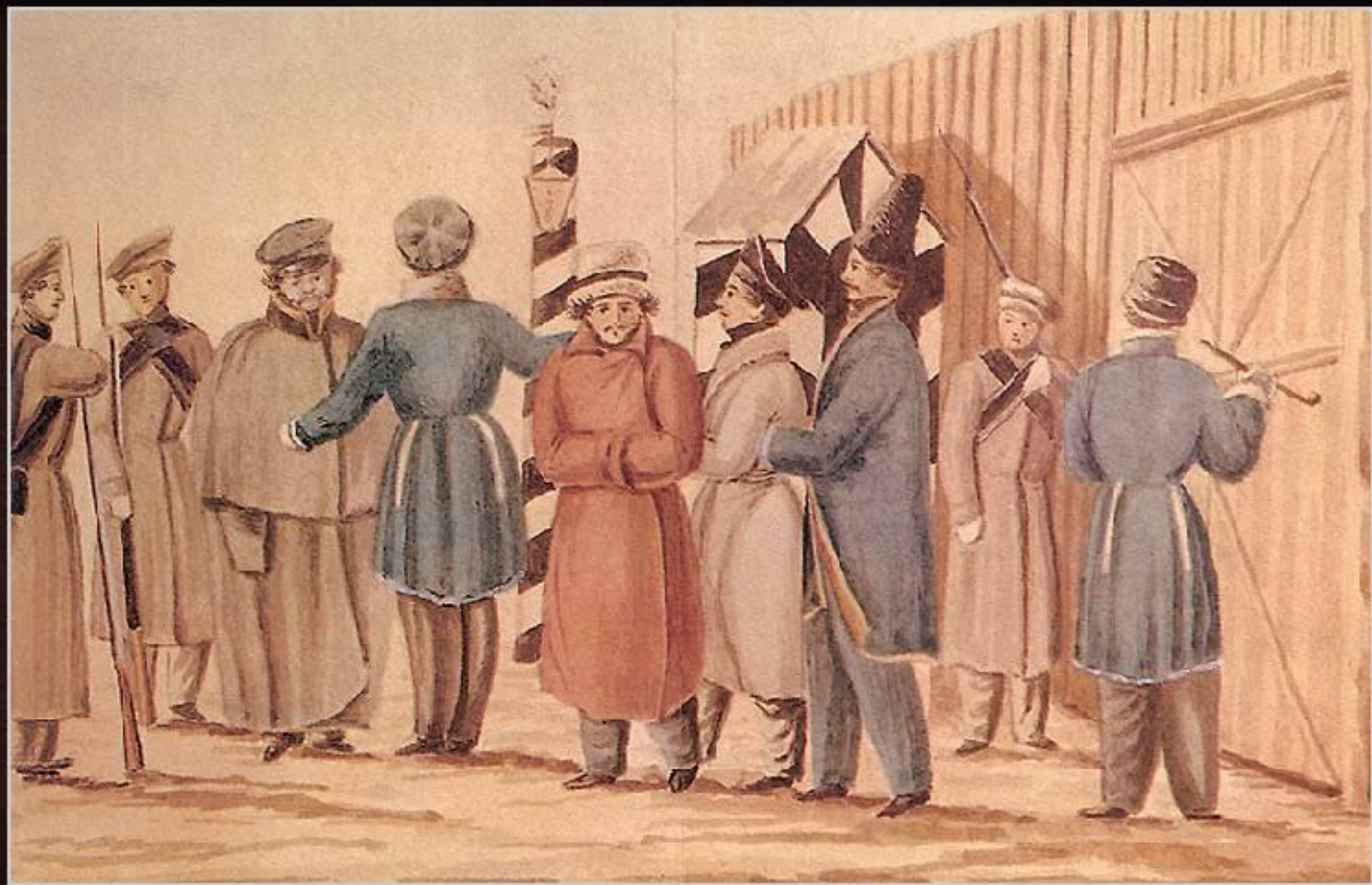
Декабристы у ворот Читинского острога

В Сибири декабристы были заняты на каторжных работах, жили в тяжелых условиях.