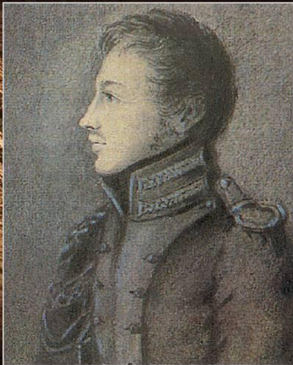
Пестель П.И. (1793-1826)

Павел Иванович Пестель - один из активнейших деятелей декабристского движения. Написал конституционный проект "Русская правда", который был принят Южным обществом. Проект предусматривал введение в России демократических свобод, учреждение республики, отмену крепостного права и частичное наделение крестьян землей.