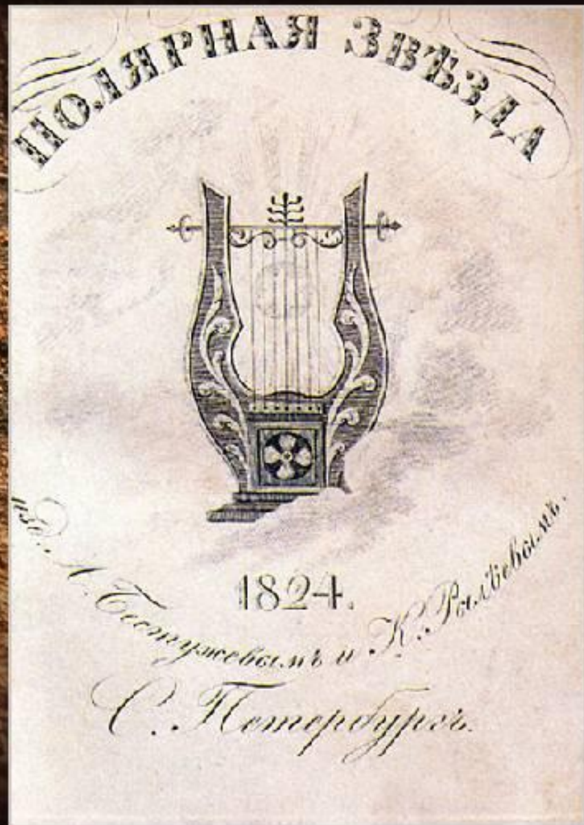
Альманах "Полярная Звезда"

Члены тайных обществ готовили военное выступление и одновременно пропагандировали свои идеи в обществе, обходя рогатки цензуры. Альманах "Полярная Звезда" издавался декабристами А.А. Бестужевым и поэтом К.Ф. Рылеевым.