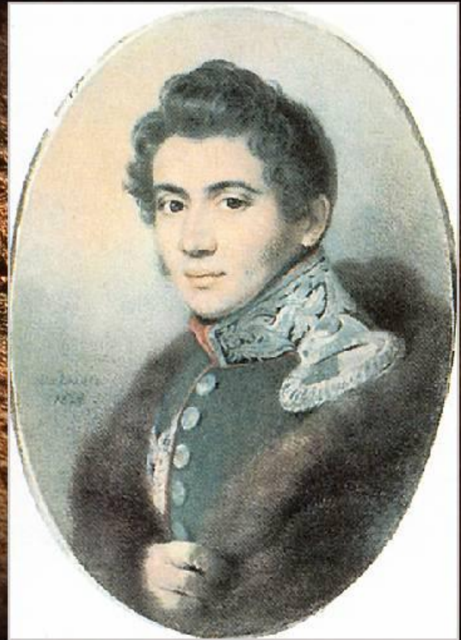
Муравьев Н.М. (1795-1843)

Никита Михайлович Муравьев - декабрист, член Северного общества, автор проекта Конституции. Проект предусматривал введение в России демократических свобод, учреждение конституционной монархии, отмену крепостного права.