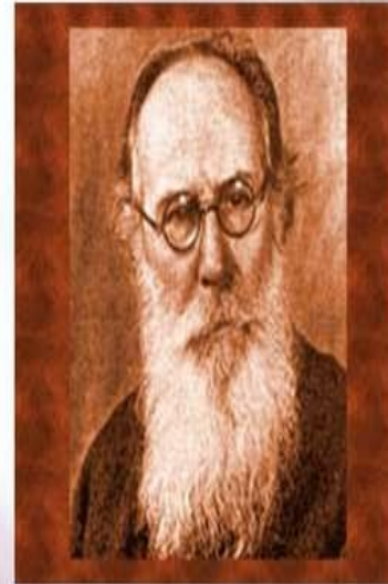
Владимир Андреевич Фаворский

Книжной иллюстрацией занялся с 1910-х гг. Проиллюстрировал издания: "Фамарь" А. П. Глобы, "Книга Руфь", "Домик в Коломне" А. С. Пушкина, "Рассказы" Б. А. Пильняка, "Новая жизнь" Данте, "Сонеты" У. Шекспира, "Р. Бернс в переводах С. Я. Маршака", "Слово о полку Игореве", "Борис Годунов", "Маленькие трагедии" А. С. Пушкина и др. Среди других работ — портреты-гравюры "Ф. М. Достоевский", "Пушкин-лицеист", бытовые портреты, фрески в Музее охраны материнства и младенчества. Оформлял театральные постановки.