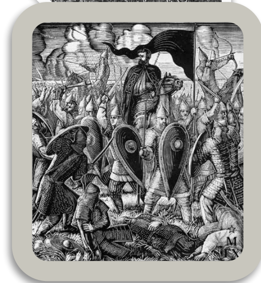
В.А.Фаворский. Иллюстрации к «Слову о полку Игореве»