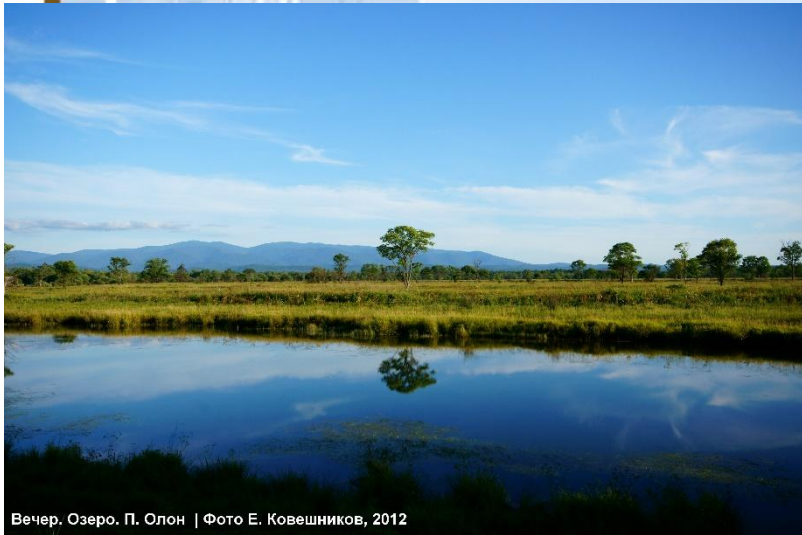
Вечер. Озеро. П. Олон | Фото Е. Ковешников, 2012