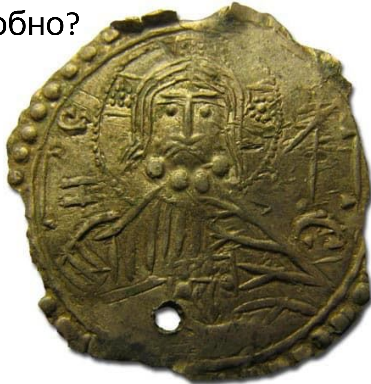
ВЛАДИМИРЪ НА СТОЛЕ (или ВЛАДИМИРЪ А СЕ ЕГО СРЕБРО)