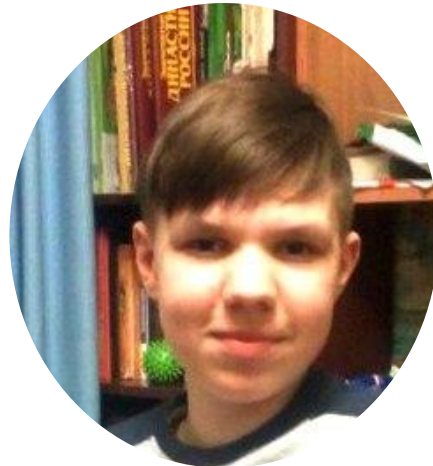
Бизнес- аналитик CFO CAO