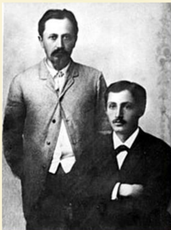
Юлий и Иван Бунины