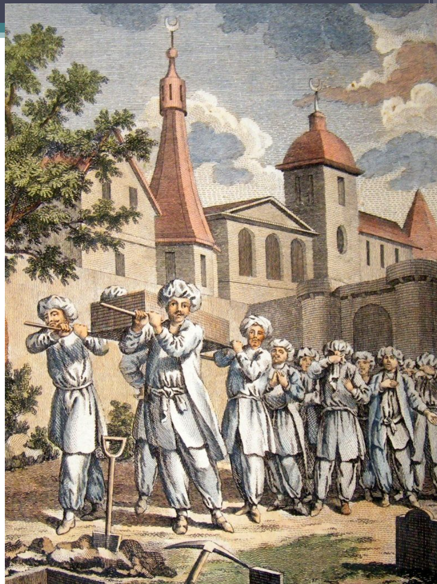
Погребальная процессия в Алжире. XVII век.

Если смерть наступила утром, тело передают погребению в тот же день, но если это происходит днем или ночью, усопшего хоронят только на следующий день. Обычно семья умершего посылает за двумя или более наддаба (плакальщицами), но некоторые порицают этот обычай и пренебрегают им, иные только для того, чтобы избежать излишних трат. Вскоре приходит мугассиль (тот, кто оmyвает мертвецов) со скамейкой, на которую он кладет тело, и специальными носилками. Приводят в дом также и фии , которым предстоит принять участие в погребальном обряде (если усопший был почтенным горожанином или был достаточно богат). Во время омовения они сидят в комнате, смежной с той, где совершается обряд, и поют суру Скот или Бурду – знаменитую поэму, восхваляющую пророка. Тело почившего оmyвают теплой водой и натирают благовониями. Умершему вставляют в уши вату (хлопок), заворачивают в белый саван и кладут в ящик из необработанного дерева.