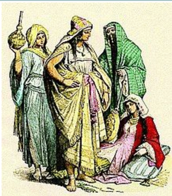
Одежда арабски х женщин , IV – VI века.