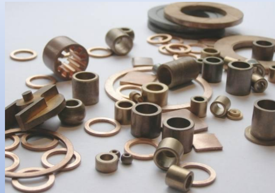
Изделия, изготовленные методом порошковой металлургии