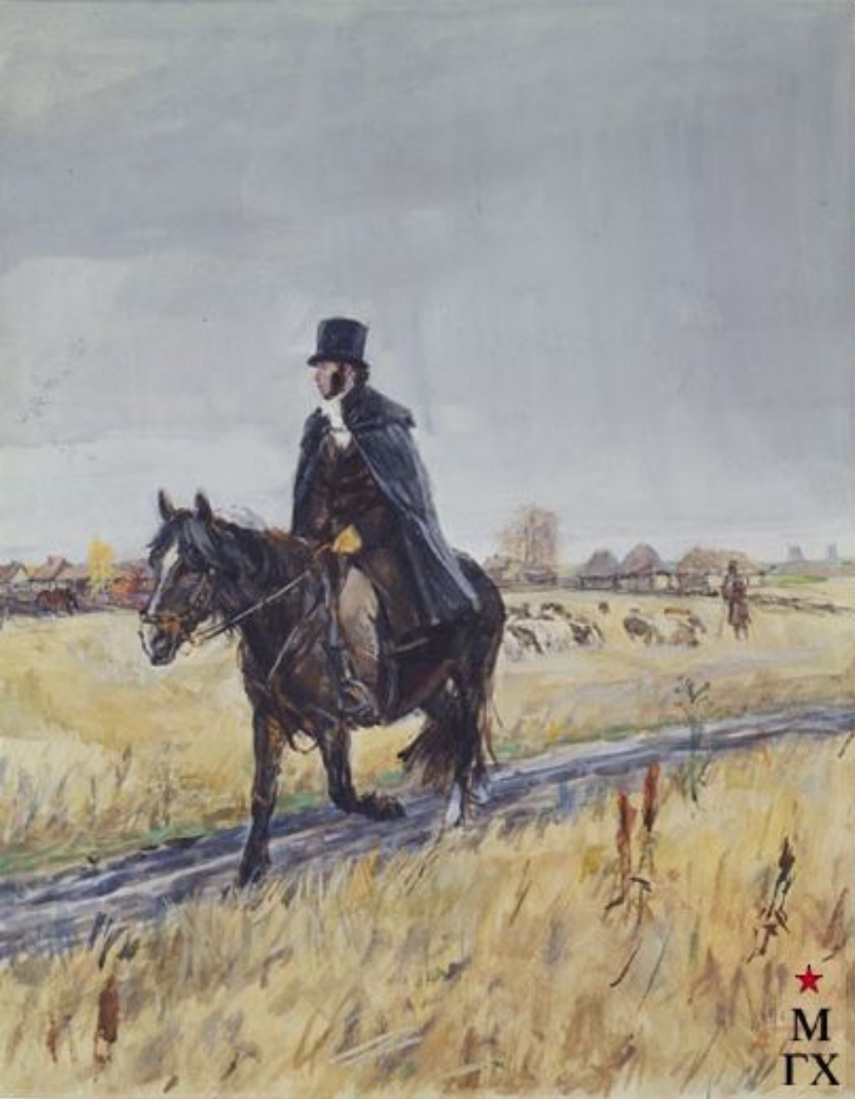
А.С. Пушкин в Болдино. 1949. бум. темпера. 60. Пластов.